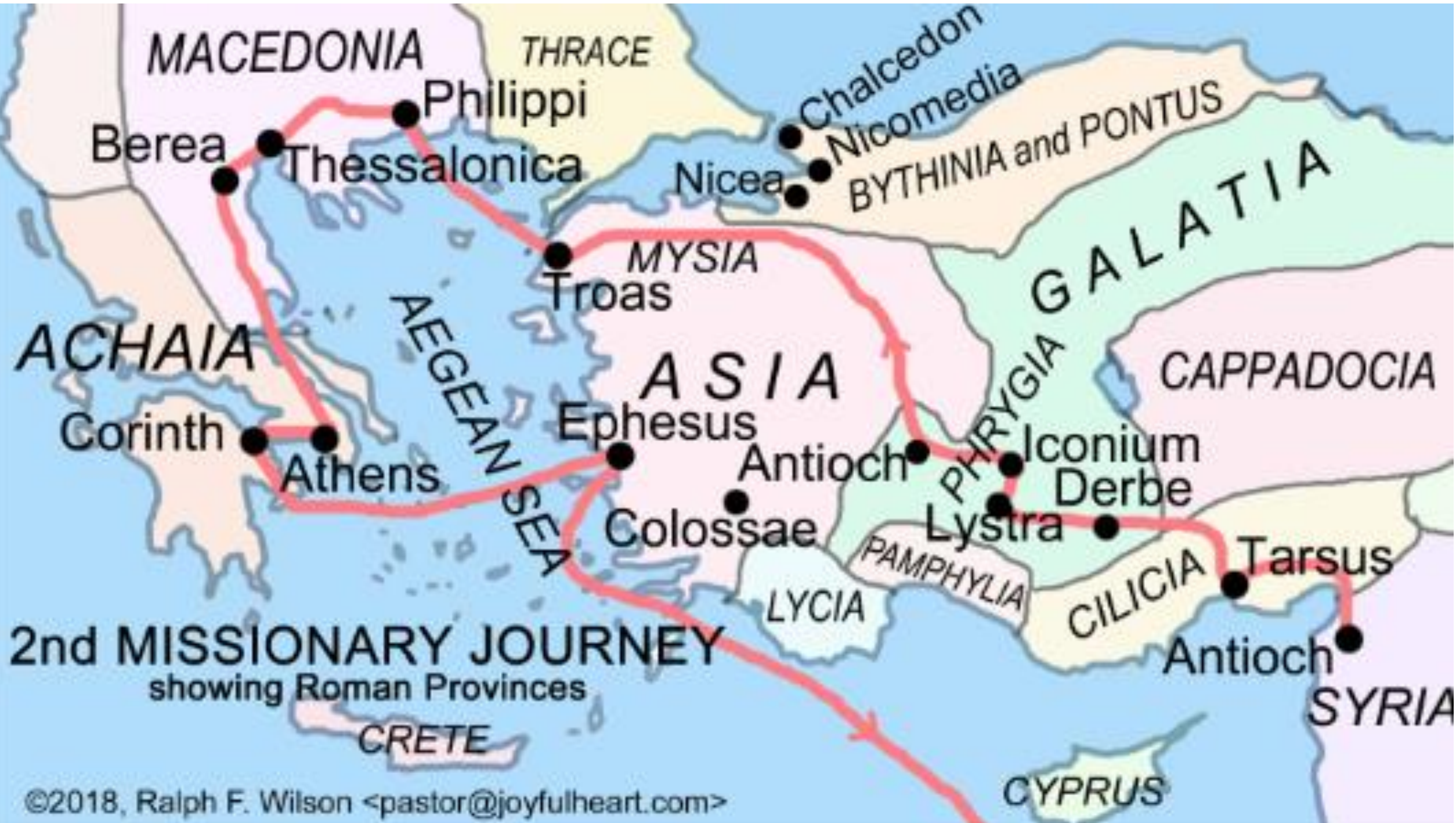
2nd MISSIONARY JOURNEY showing Roman Provinces